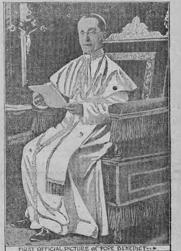
Esta es la primera fotografía oficial del nuevo Pontífice Benedicto XV. Su Santidad estaba sentado en el trono papal con el traje de su apostolado. Su reinado fue enlutado desde un principio con la muerte del Cardenal Ferrata, Secretario de Estado del Papa y su amigo personal se puede decir de toda la vida. El Pontífice cumplió años el sábado próximo pasado. Nació en Pegli, cerca de Génova, el 21 de noviembre de 1854; tiene en consecuencia 60 años de edad.

Primera fotografía oficial de S. S. Benedicto XV